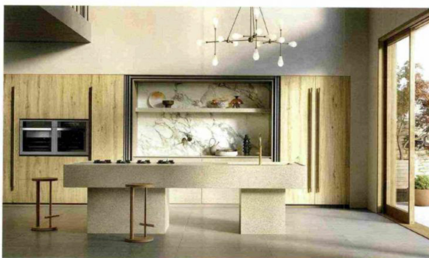
Le frelon Serrato Beige de la nouvelle collection Il Veneziano de SapienStone.

Spécialisée dans le domaine de la céramique, la marque du groupe italien Iris Ceramica se déploie sur le marché français de la cuisine équipée. Focus.