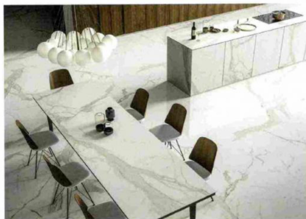
La gamme Active Surfaces se compose de plans antibactériens, antiviraux, anti-polluants, anti-odeurs, autonettoyants et certifiés ISO.

La marque SapienStone profite évidemment de l'expertise de sa maison mère pour offrir une gamme complète de textures et de finitions (naturelle, brillante, semi-polie). Au total, 32 décors sont ainsi disponibles au sein du catalogue. Ils réinterprètent les marbres, bétons et pierres naturelles. Réalisés dans des couleurs pleine masse, les plans de travail SapienStone se distinguent par une approche en trois dimensions du produit au niveau du veinage et de la reproduction des reliefs et imperfections. Comme chez l'ensemble des industriels de la céramique, un processus de pressage et de cuisson à hautes températures transforme les argiles et minéraux sélectionnés en grandes dalles de 3.200 x 1.500 mm en épaisseur standard de 12 mm, ou 20 mm dans certaines variantes. Egalement adaptées à une utilisation en espace extérieur, les surfaces SapienStone ne craignent ni la lumière du soleil ni les agents atmosphériques et peuvent donc être